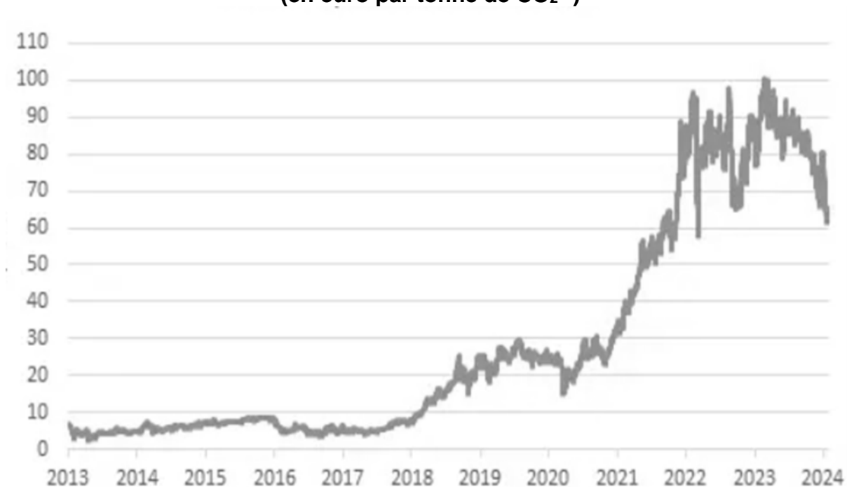
Le marché européen du carbone (SEQE-UE) 1 (en euro par tonne de CO 2 2 )